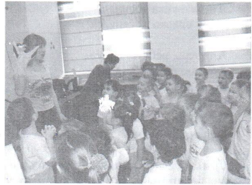
Встреча со Старушкой-Веселушкой, которая загадывает загадки, и с Совушкой