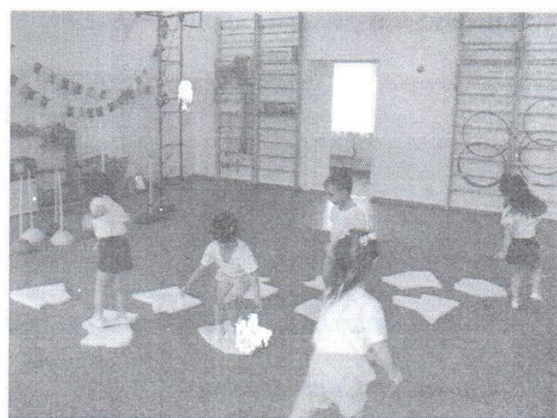
Кидаем снежки в корзину и переходим озеро по льдинкам