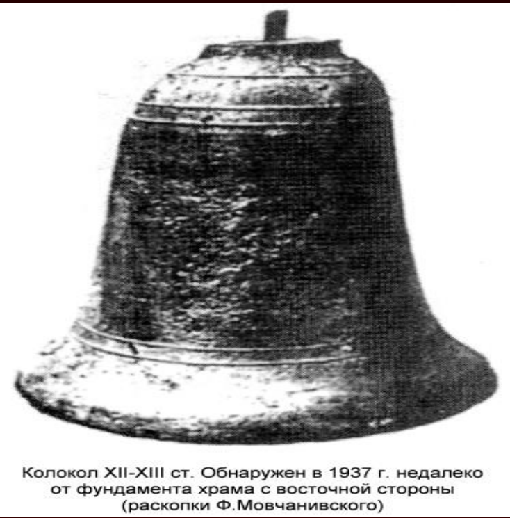
Колокол XII-XIII ст. Обнаружен в 1937 г. недалеко от фундамента храма с восточной стороны (раскопки Ф.Мовчанивского)

Еще раньше, до появления каланчи, если случался пожар, звонили в пожарный колокол. На звук сбегались люди и тушили пожар.