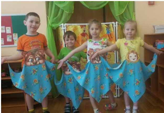
«Три медведя и Маша»