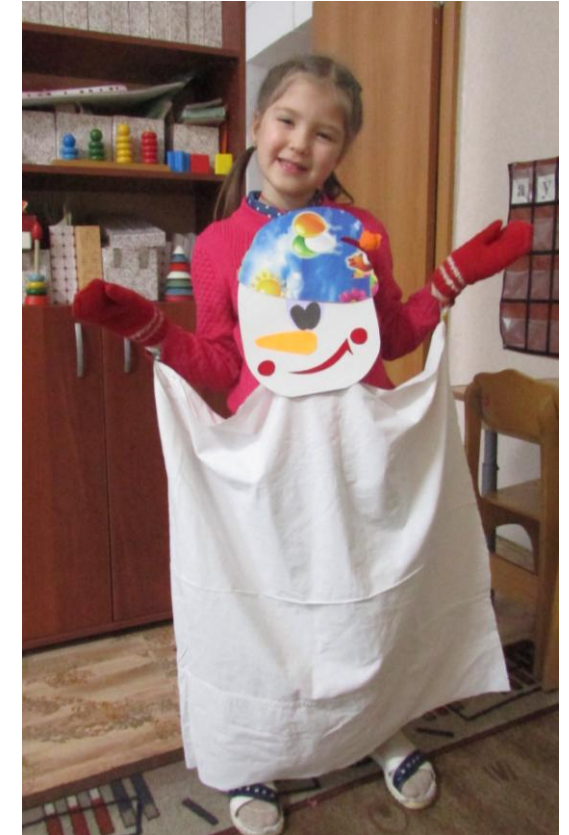
Платковая кукла «Снеговичок»