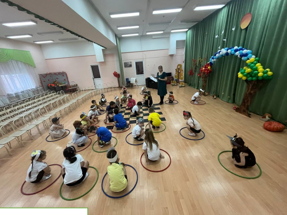
«Синичкин день» в музыкальном зале 12 ноября.