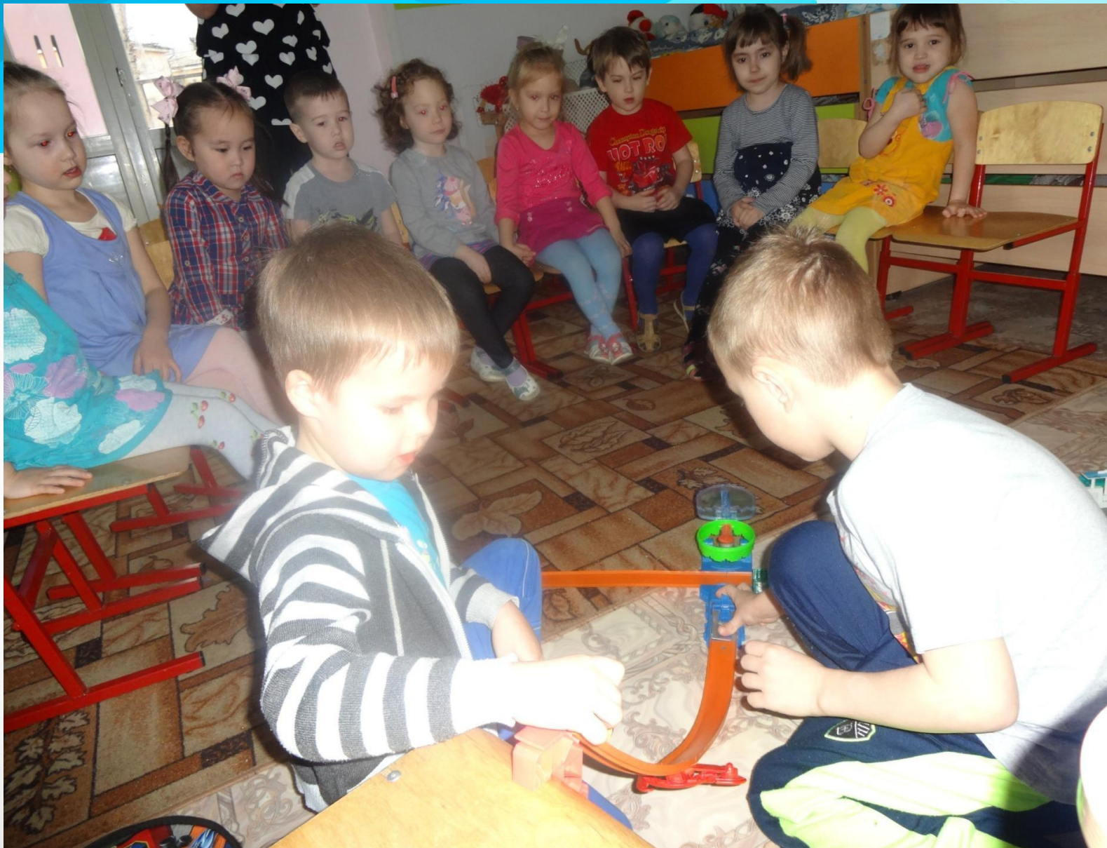
«Три коллекции», группа № 12, воспитатель