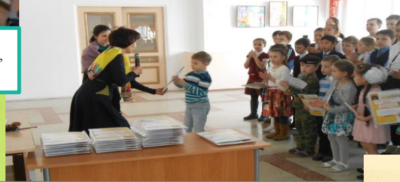
Конкурс детских проектов «Я – исследователь», 1, 2 и Гран-при