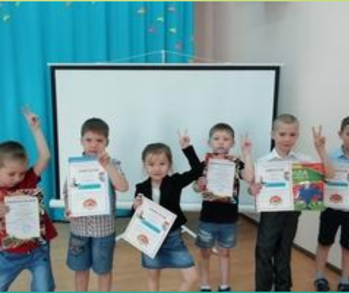
Всероссийский фестиваль творческих открытий и инициатив "Леонардо", 3 место