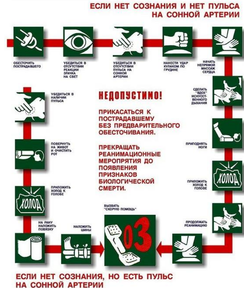
СХЕМА ДЕЙСТВИЙ В СЛУЧАЕ ПОРАЖЕНИЯ ЭЛЕКТРИЧЕСКИМ ТОКОМ